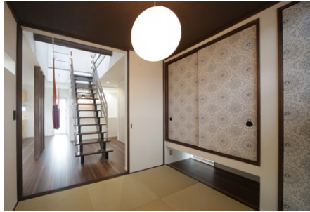
※写真はあなぶきホームの施工事例です。