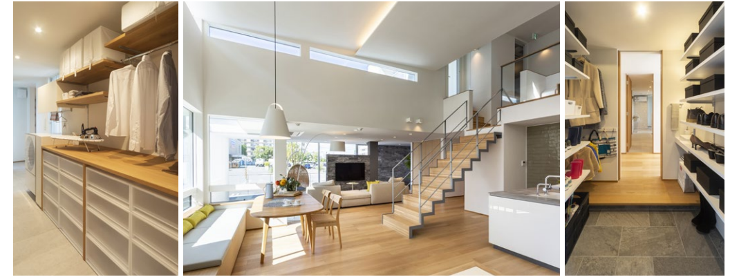
あなぶきホームの家 モデルハウス公開中 ●営業時間/10:00~18:00(毎週水曜定休) ●高松国際ホテル駐車場内

SE構法を採用した、大きな窓と大空間のリビングダイニング、こだわりの収納スペースが詰まったお家です。お気軽にご見学ください。